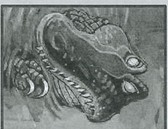
Le crocodile marin