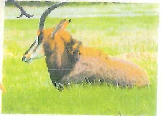
▲ un hippotrague