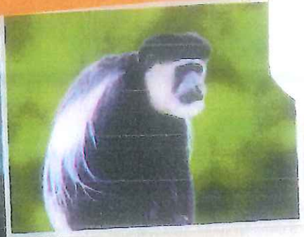
▲ Le colobe naît tout blanc et ses poils noircissent après.