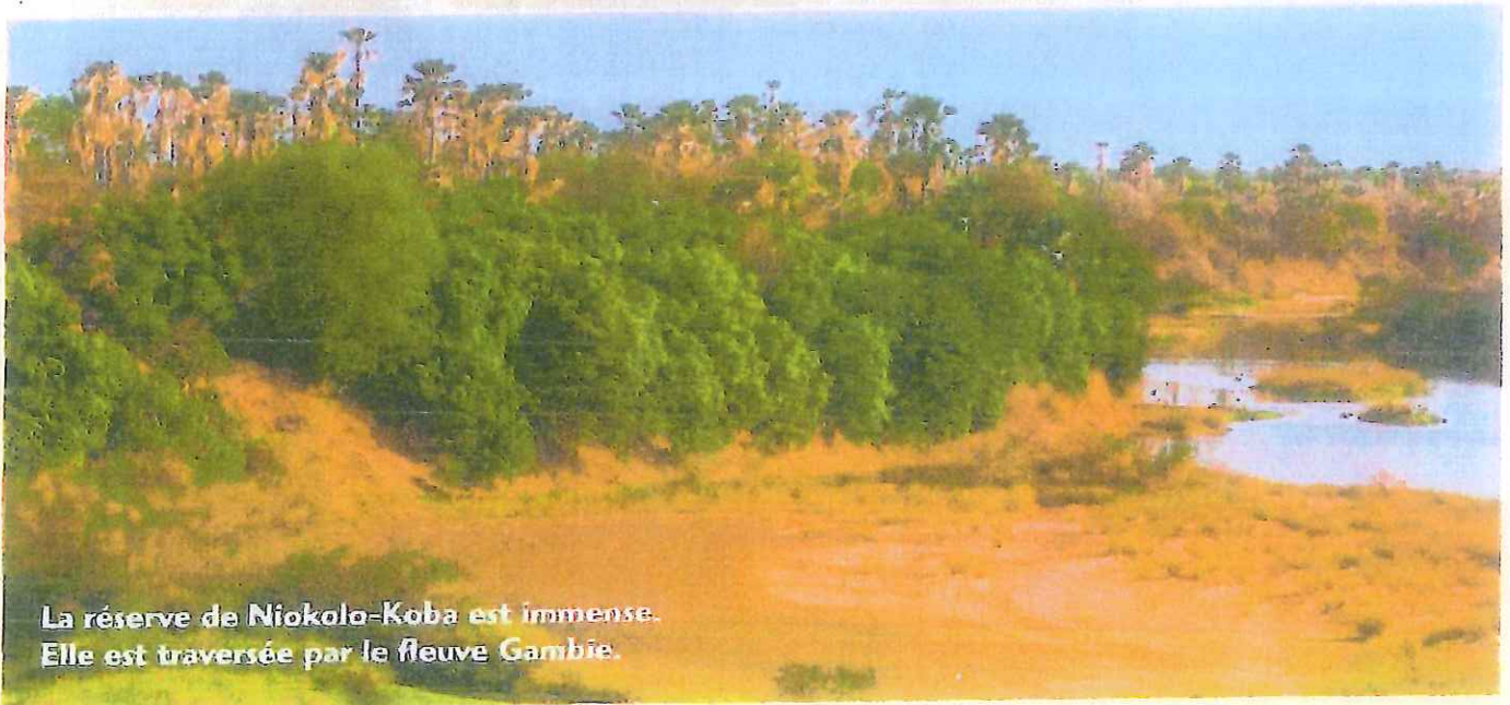
La réserve de Niokolo-Koba est immense. Elle est traversée par le fleuve Gambie.