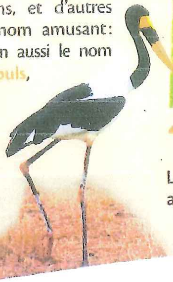
▶ un jabiru

Les vacances étaient finies, nous avons repris la route vers Dakar.