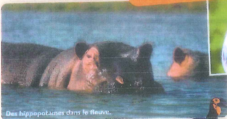
Des hippopotames dans le fleuve.