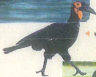
◀ un calao terrestre

En étant patients, nous avons pu voir beaucoup d'animaux. Nous avons aperçu des singes verts, des lions, et d'autres mammifères qui ont un nom amusant : les hippotragues. J'aime bien aussi le nom de certains oiseaux : les bulbuls, les calaos et les jabirus. Il ne faut pas descendre des voitures car ce sont des animaux sauvages* : ils peuvent être dangereux.