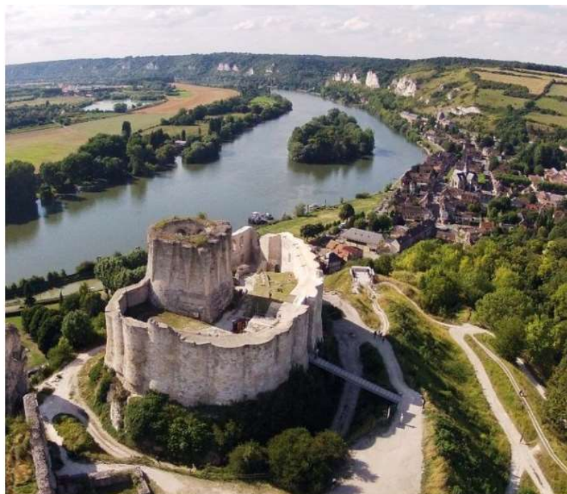
Petite vidéo sur château Gaillard https://youtu.be/YF_xAoKB6k8