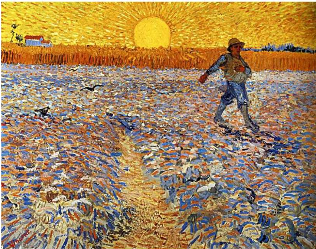
Le Semeur au soleil couchant Van Gogh, Arles, 1888, huile sur toile, 64 × 80,5 cm.

A ton tour de réaliser ton portrait, ou un paysage à la façon de