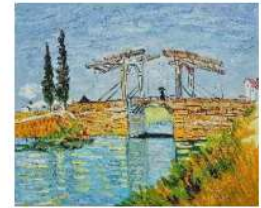
pont de Langlois

exotisme : caractère de ce qui évoque les mœurs, les habitants ou les paysages des pays lointains