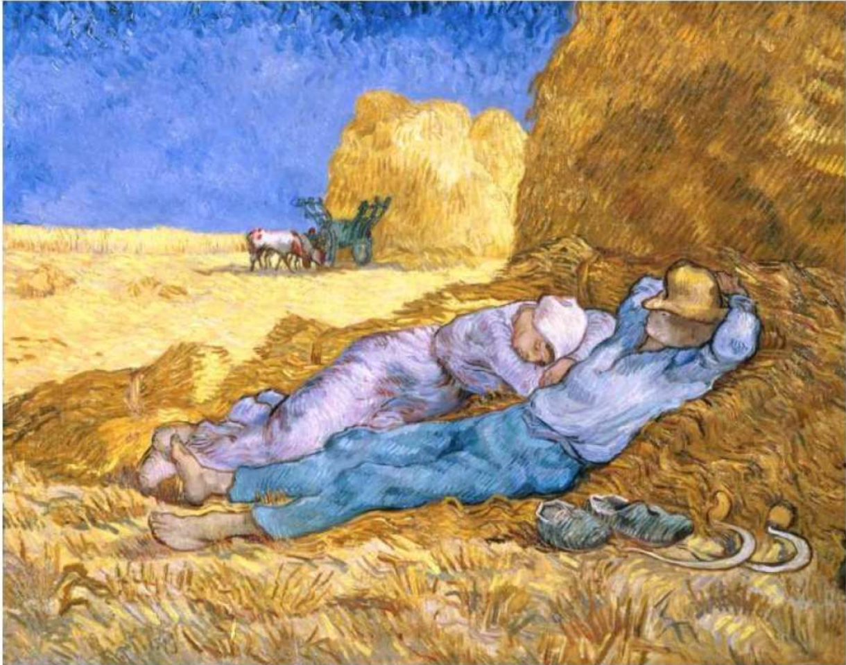
Vincent Van Gogh, d'après Millet, La Méridienne dit aussi La Sieste, 1890, huile sur toile, 73 x 91 cm, Musée d'Orsay, Paris

Dès 1888, Van Gogh est à Arles, à la recherche d'une lumière, de couleurs que l'exotisme des œuvres japonaises, très en vogue alors, lui avait révélées. Les couleurs pures, les traits tourbillonnants s'imposent dans les œuvres majeures de son œuvre, qui se créent durant deux années très actives. Le jaune, le vert et le bleu dominent, les courbes s'installent dans l'espace du tableau.