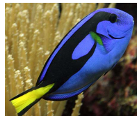
Poisson chirurgien bleu