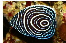
Poisson ange empereur